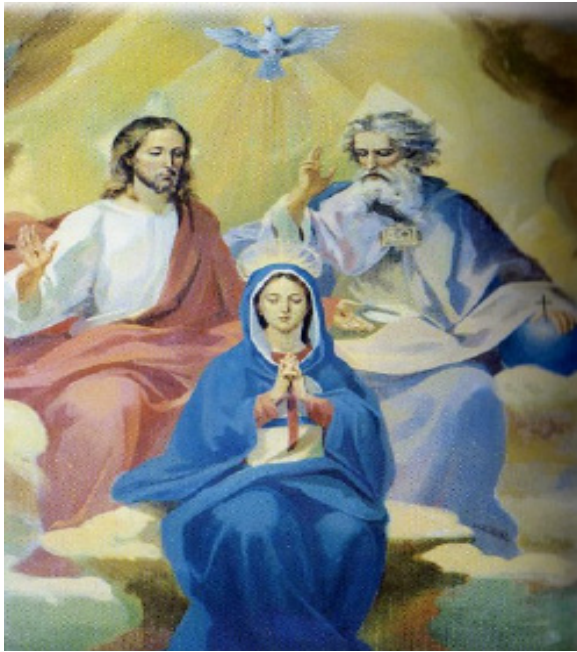
Mary and the Most Holy Trinity