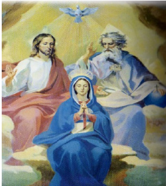
María y la Santísima Trinidad