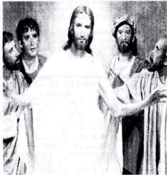
MIRAD MIS MANOS Y MIS PIES; SOY YO MISMO