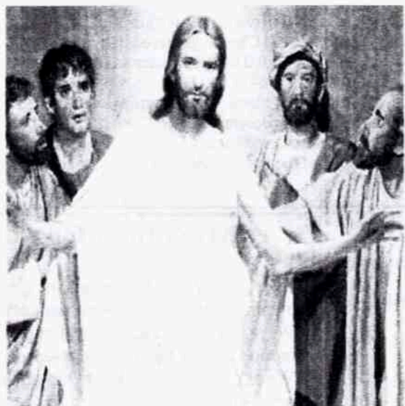
LOOK AT MY HANDS AND FEET AND SEE THAT IT IS I MYSELF