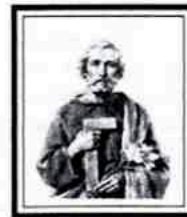
San José Obrero