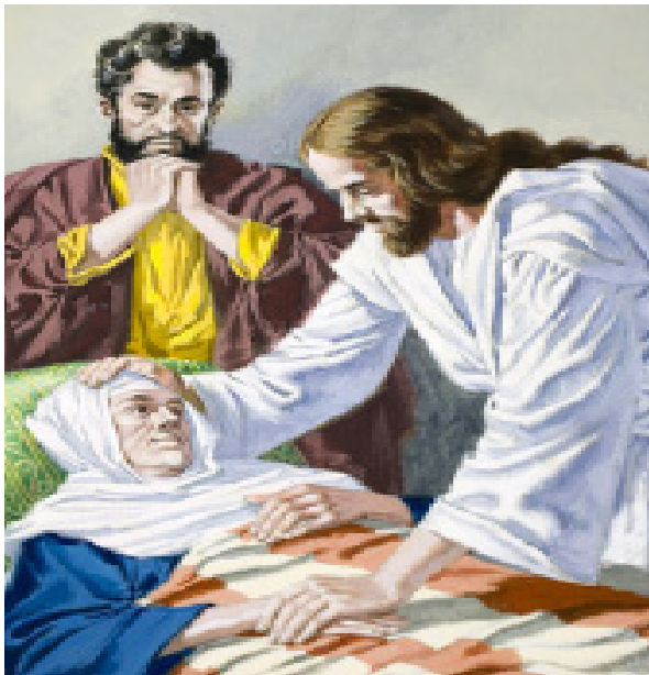
Jesús le da la mano, la levanta de su postración y la devuelve al servicio.

V Domingo en Tiempo Ordinario Febrero 7-8, 2015