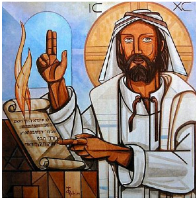
Proclaiming the Good News

III Sunday in Ordinary Time January 23-24, 2016