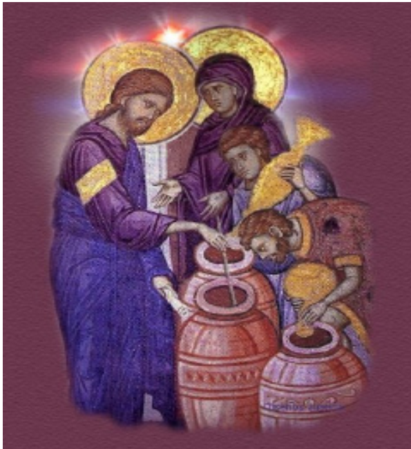
The Wedding Feast of Cana

II Sunday in Ordinary Time January 19-20, 2013