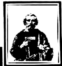
San José Obrero