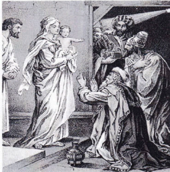
The Kings offered Him Gold, Incense & Mire

The Epiphany of the Lord January 5-6, 2013