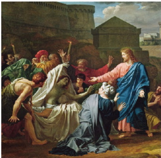
"The dead man got up and began to speak."

X Sunday in Ordinary Time June 8-9, 2013